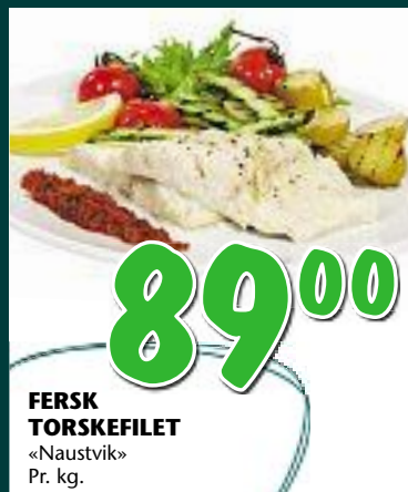
FERSK TORSKEFILET «Naustvik» Pr. kg.

Nidarvoll - Moholt - Valentinlyst - Melhus 9-22 (20) Stjørdal 9-20 (18)