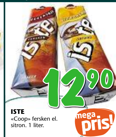
ISTE «Coop» fersken el. sitron. 1 liter.